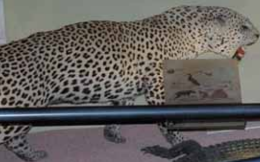
Exhibit No. 100000