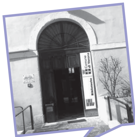
BIBLIOTECHE DI QUARTIERE